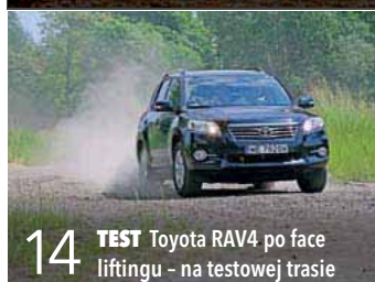
14 TEST Toyota RAV4 po face liftingu - na testowej trasie