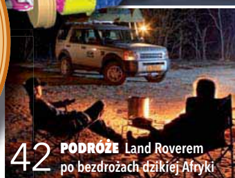
42 PODRÓŻE Land Roverem po bezdrożach dzikiej Afryki