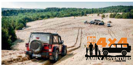
72 Na piaskach Pustyni Siedleckiej i w magicznych Górach Sowich zakończyliśmy tegoroczny sezon 4x4 FA.