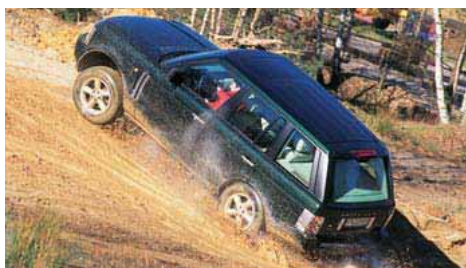
40 Luksusowy Range Rover świetnie radzi sobie w terenie, ale jego naprawy są kosztowne.