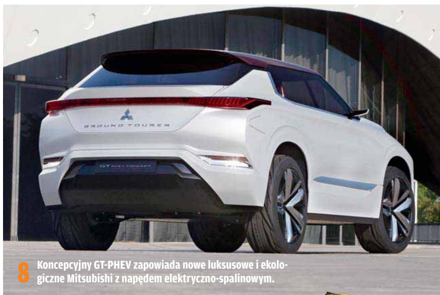
8 Konceptyjny GT-PHEV zapowiada nowe luksusowe i ekologiczne Mitsubishi z napędem elektryczno-spalinowym.