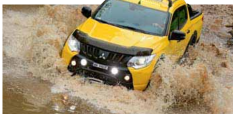
32 L200 po offroadowym tuningu pokona trudniejsze przeszkody, ale ucierpiał komfort na szosie.